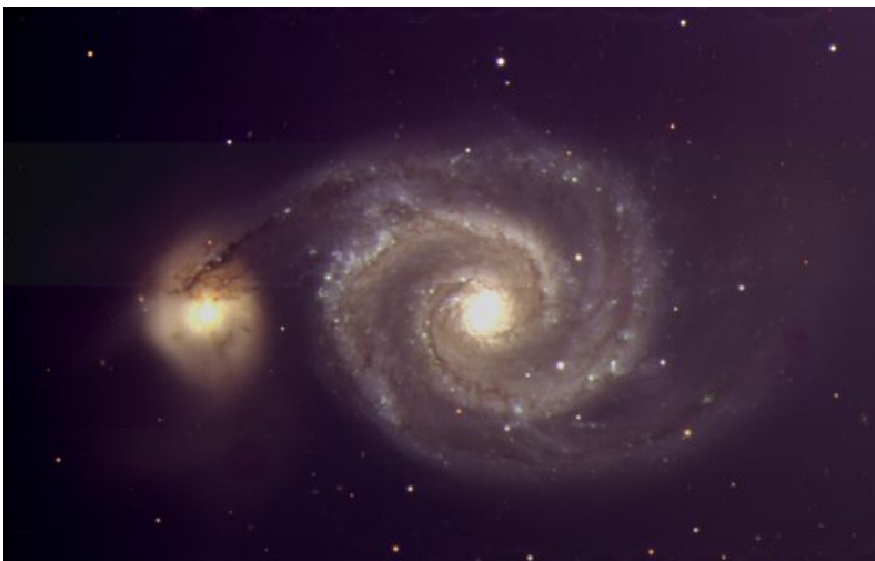
Galaxia M51, o del remolino, situada a unos 23 millones de años luz de la Tierra, fotografiada con la PAUcam el 6 de junio de 2015.

Archivado en: Agencias espaciales Observatorios astronómicos Astronáutica Centros investigación Física Investigación científica España Universo Ciencias exactas Astronomía Ciencia